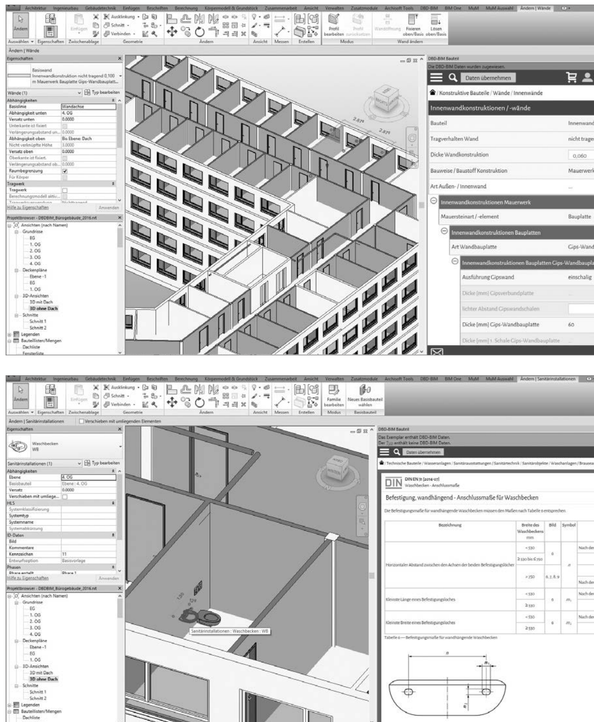
Abb. 5/6: Ansichten eines Bestandplans